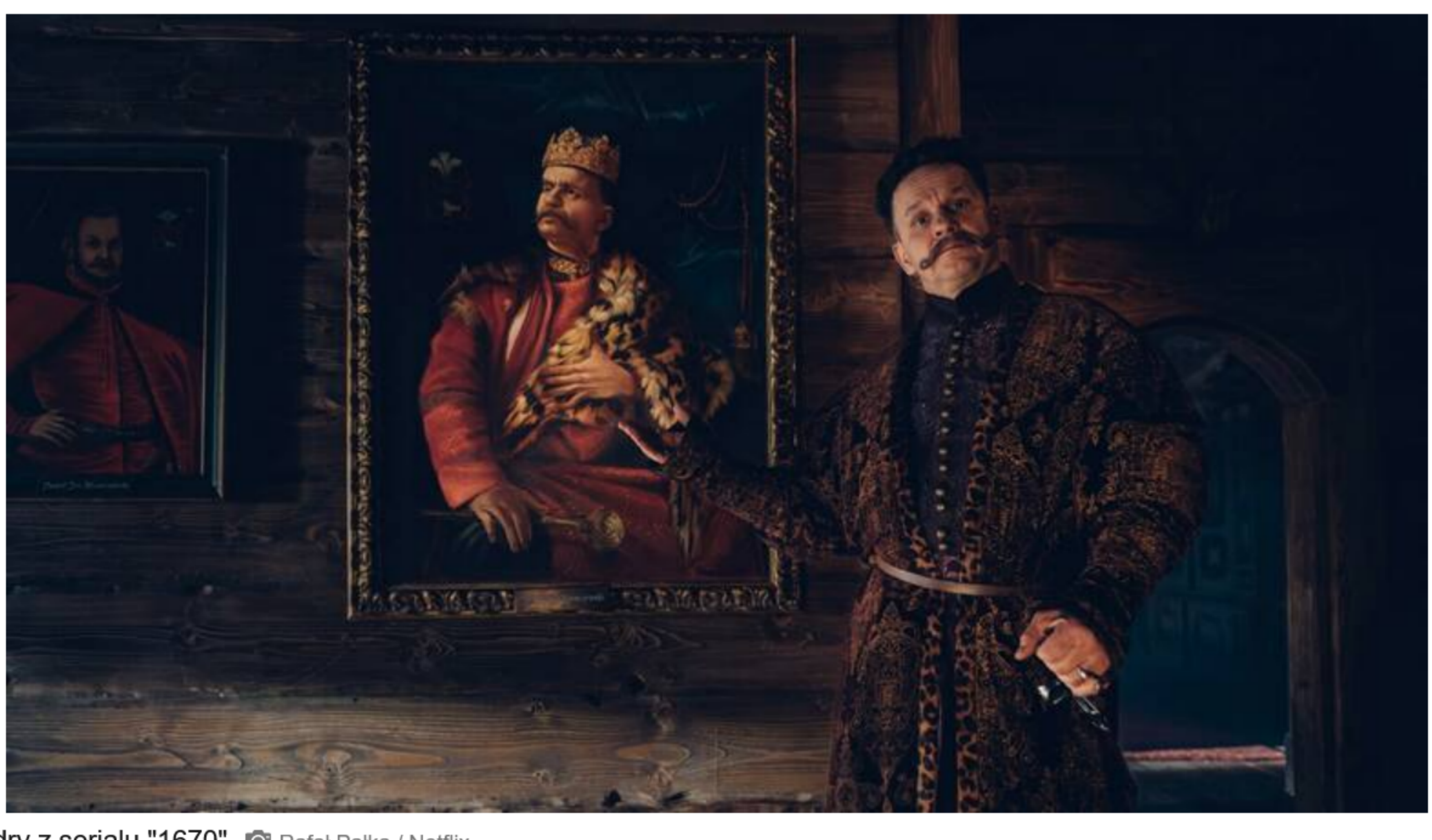
Kadry z serialu "1670"

Serial opowiada o szlachcicu Janie Pawle (w tej roli Bartłomiej Topa ), który włada częścią wsi Adamczycha . Główny bohater marzy o zapisaniu się na kartach historii Polski. Jego życie, choć dostatnie, pełne jest codziennych problemów. Wraz z trójką dzieci oraz żoną Zofią musi zmierzyć się z wyzwaniami, jakie stawia przed nimi XVII wiek. Serial ukazuje życie szlachty, ich codzienność, ale także ich przewrotną naturę.