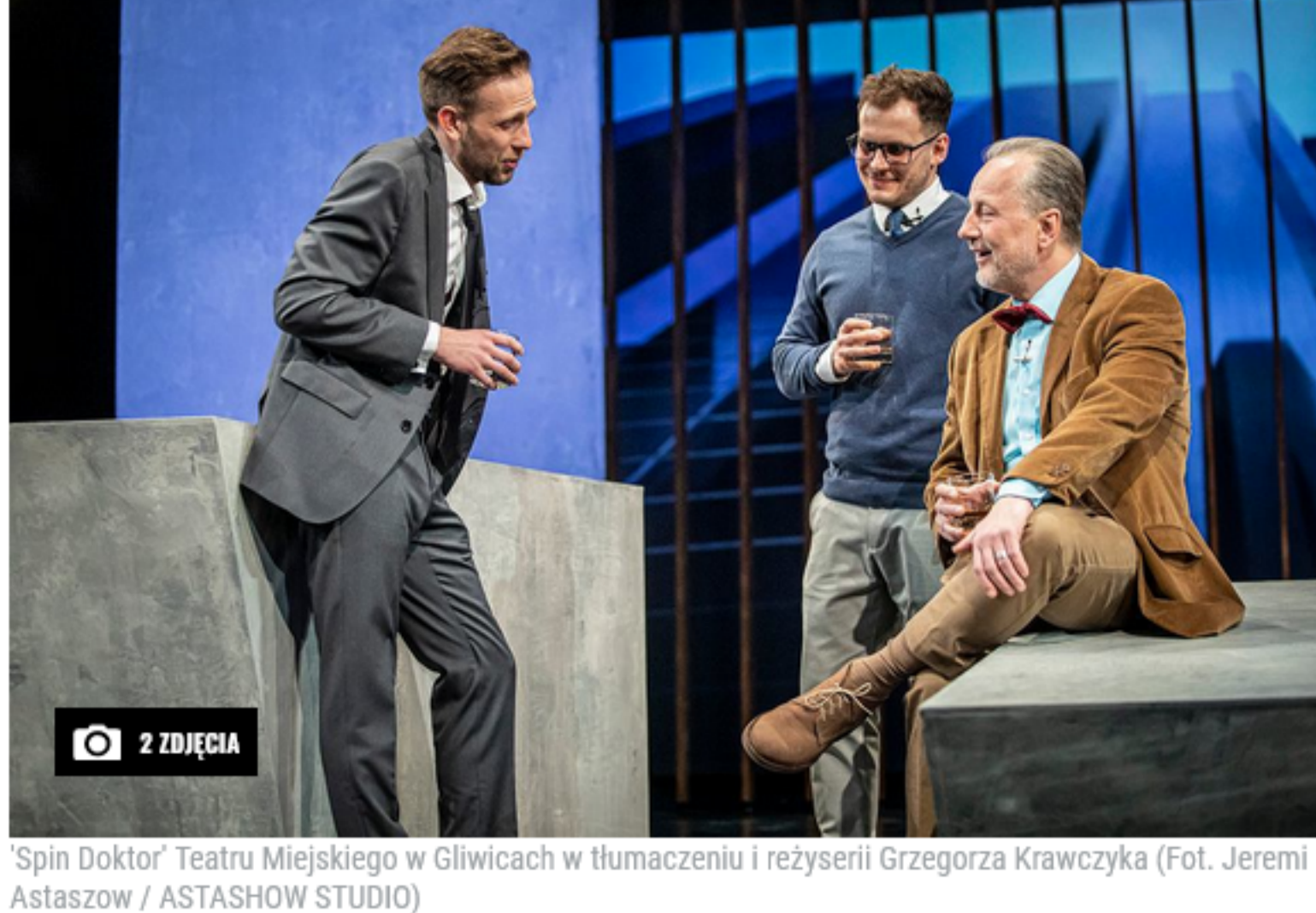
"Spin Doktor" Teatru Miejskiego w Gliwicach w tłumaczeniu i reżyserii Grzegorza Krawczyka

Maria Sławińska 17 kwietnia 2022 | 09:30