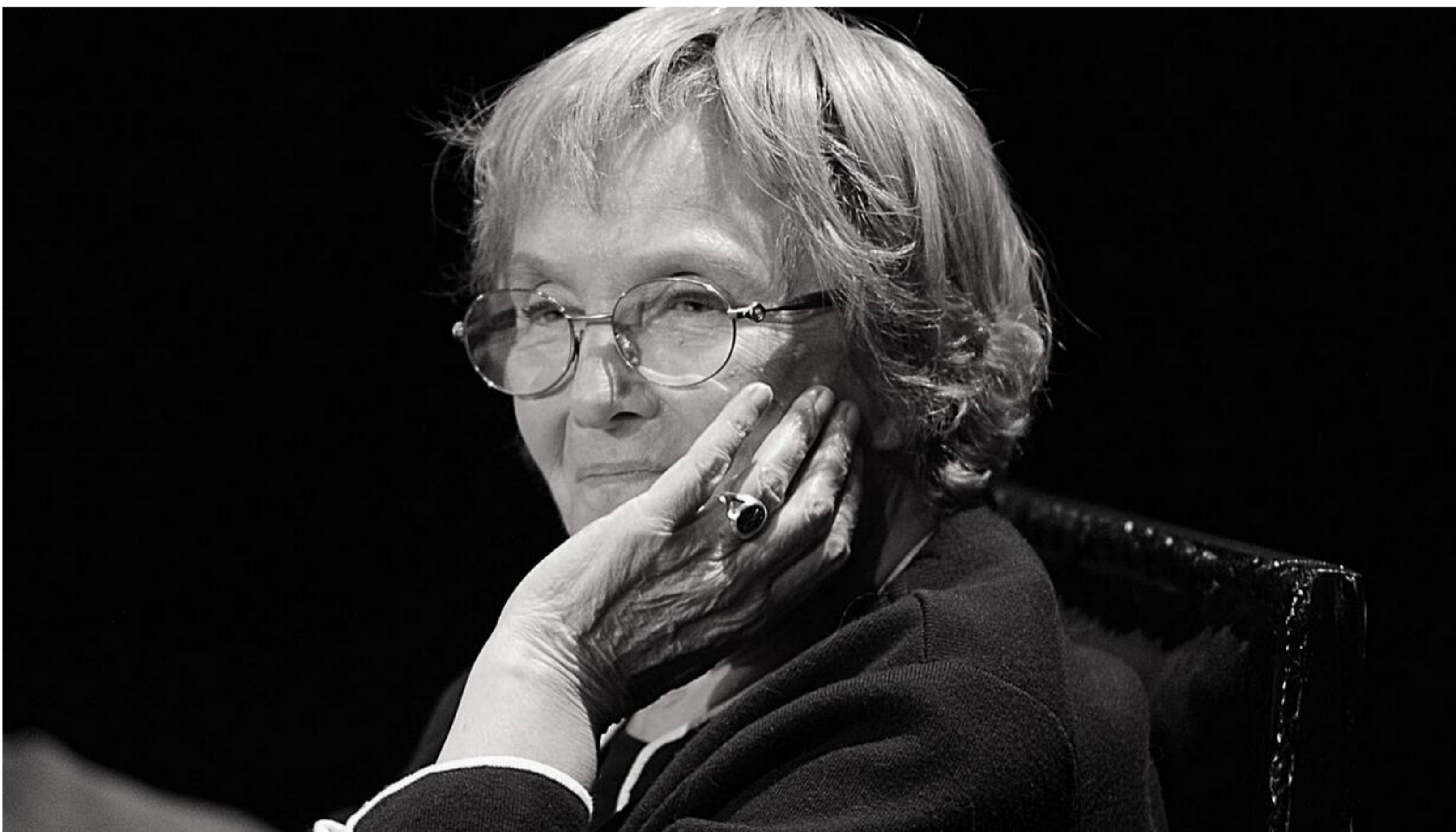
Izabella Cywińska.

Odeszła Izabella Cywińska - oddana całe życie polskiej kulturze odważna obrończyni wartości podstawowych i pierwsza ministra kultury niepodległej Polski - napisał w niedzielę minister kultury Bartłomiej Sienkiewicz.