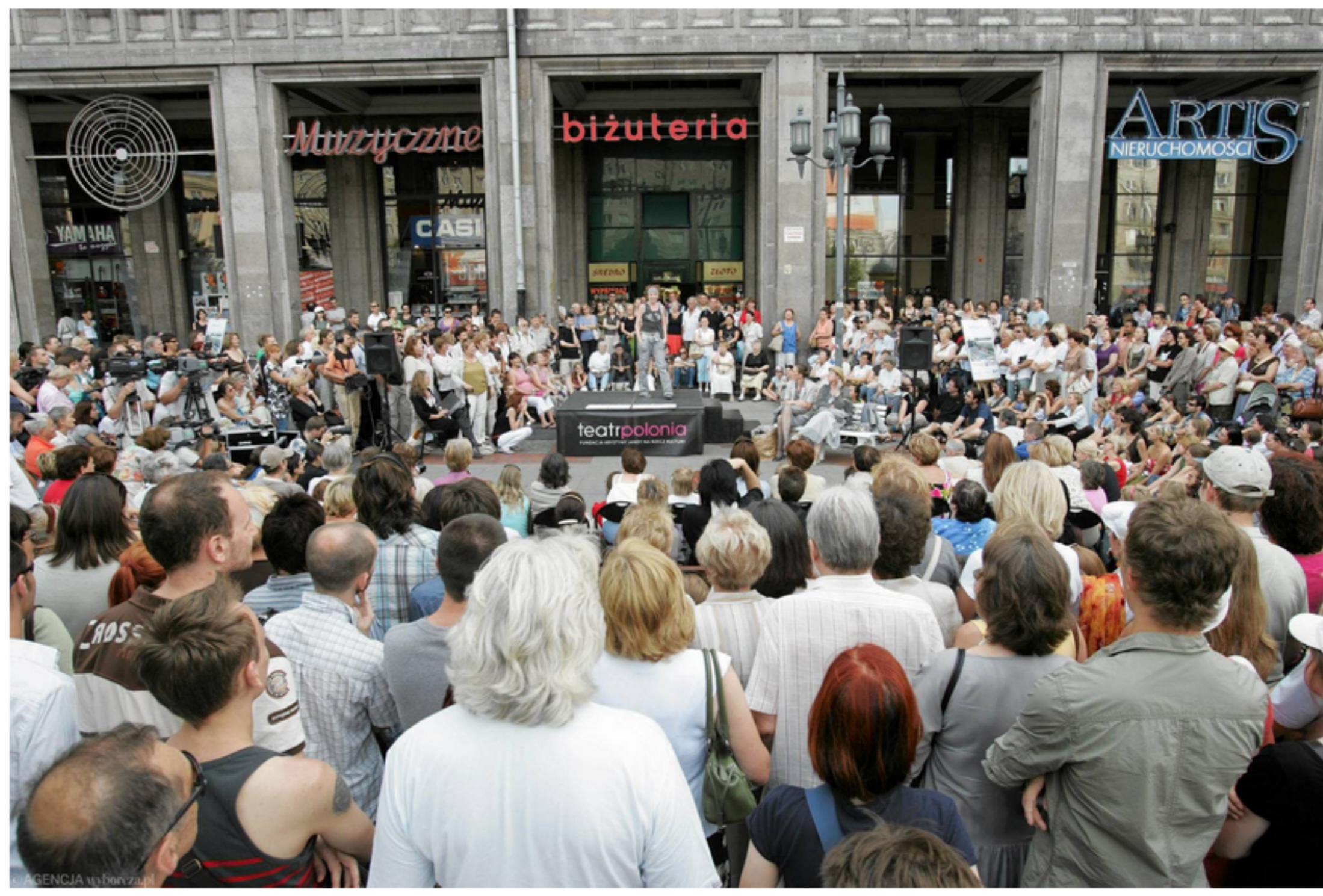
Przedstawienie plenerowe Teatru Polonia na pl. Konstytucji.

Z kolei "Lament" Krzysztofa Bizia to sztuka, która od lat zbiera największą publiczność na placu. Repertuar teatru ulicznego jest jednak bogaty, więc każdy powinien znaleźć coś dla siebie.