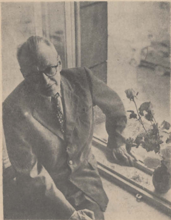
LUDWIK HIERONIM MORSTIN