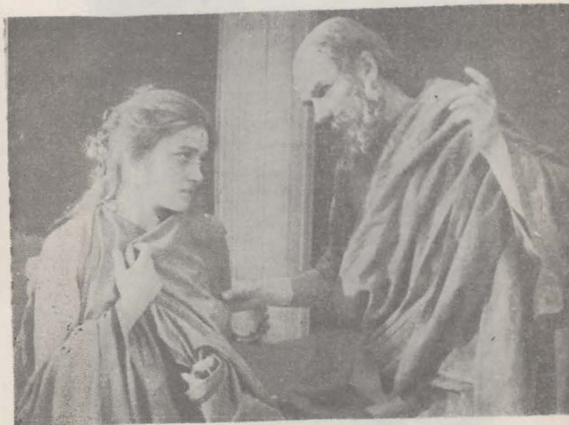
L. H. Morstin — Obrona Ksantypy Bydgoszcz 1947 r.

Dużą pozycję w twórczości Morstina stanowią także tłumaczenia poetyckie: „Antygony” Sofoklesa, „Owczego źródła” Lope de Vegi, „Alfonsa z Zalamei” Calderona i „Torquata Tasso” Goethego.