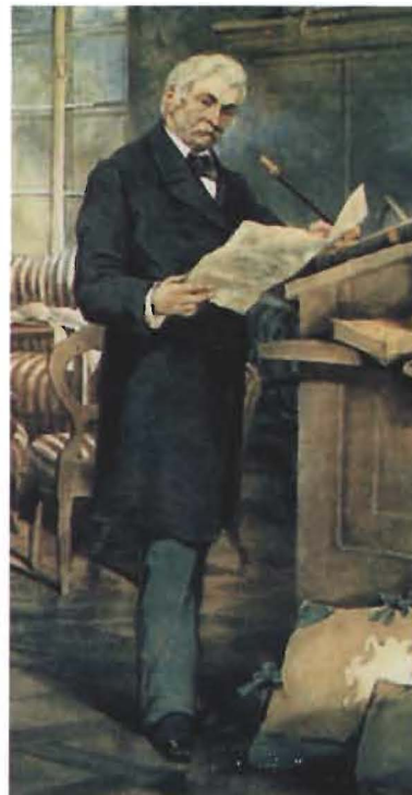
Aleksander Fredro - obraz Juliusza Kossaka, 1884