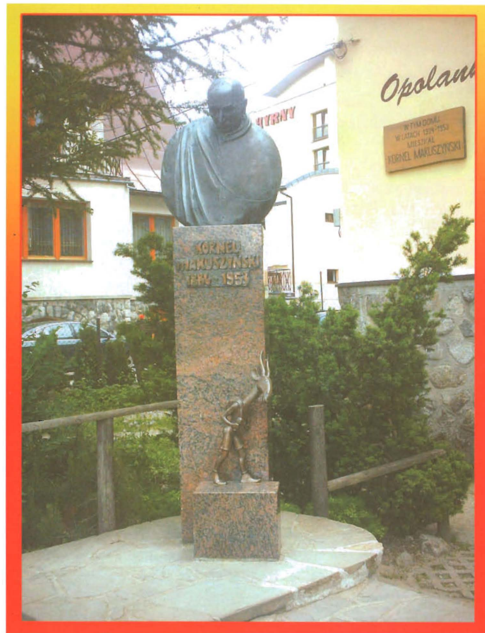
Pomnik Kornela Makuszyńskiego przed willą Opolanka w Zakopanem.