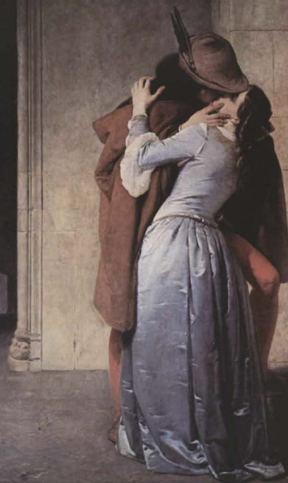
Francesco Hayez "Pocałunek", 1859, Mediolan, Pinacoteca di Brera

W muzyce jest to pieśń liryczno – sentymentalna, pierwotnie o tematyce rycerskiej, bohaterskiej, mająca prostą budowę zwrotkową, popularna pod koniec XVIII wieku.