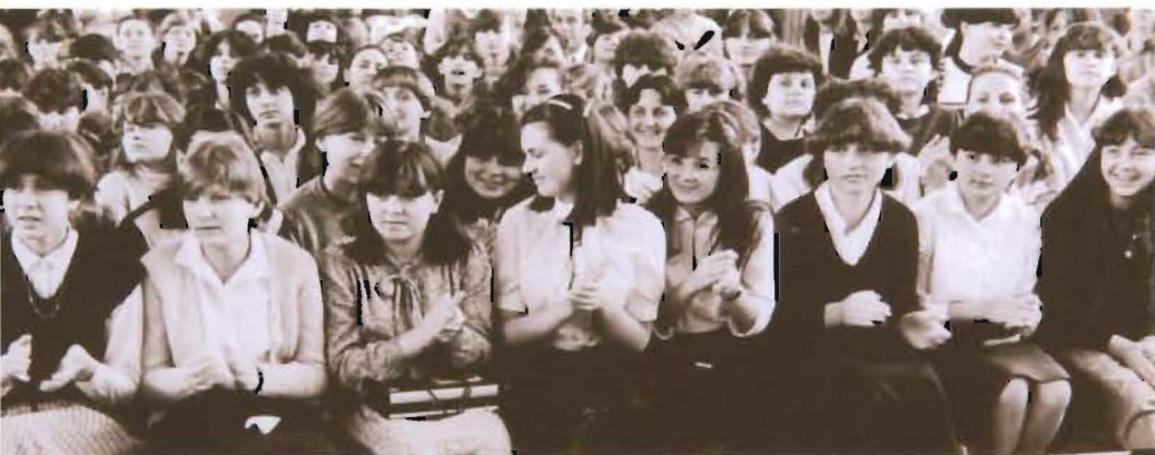
Młodzież podczas spektaklu „Śpiewam Miłosny Rym”, 1982.