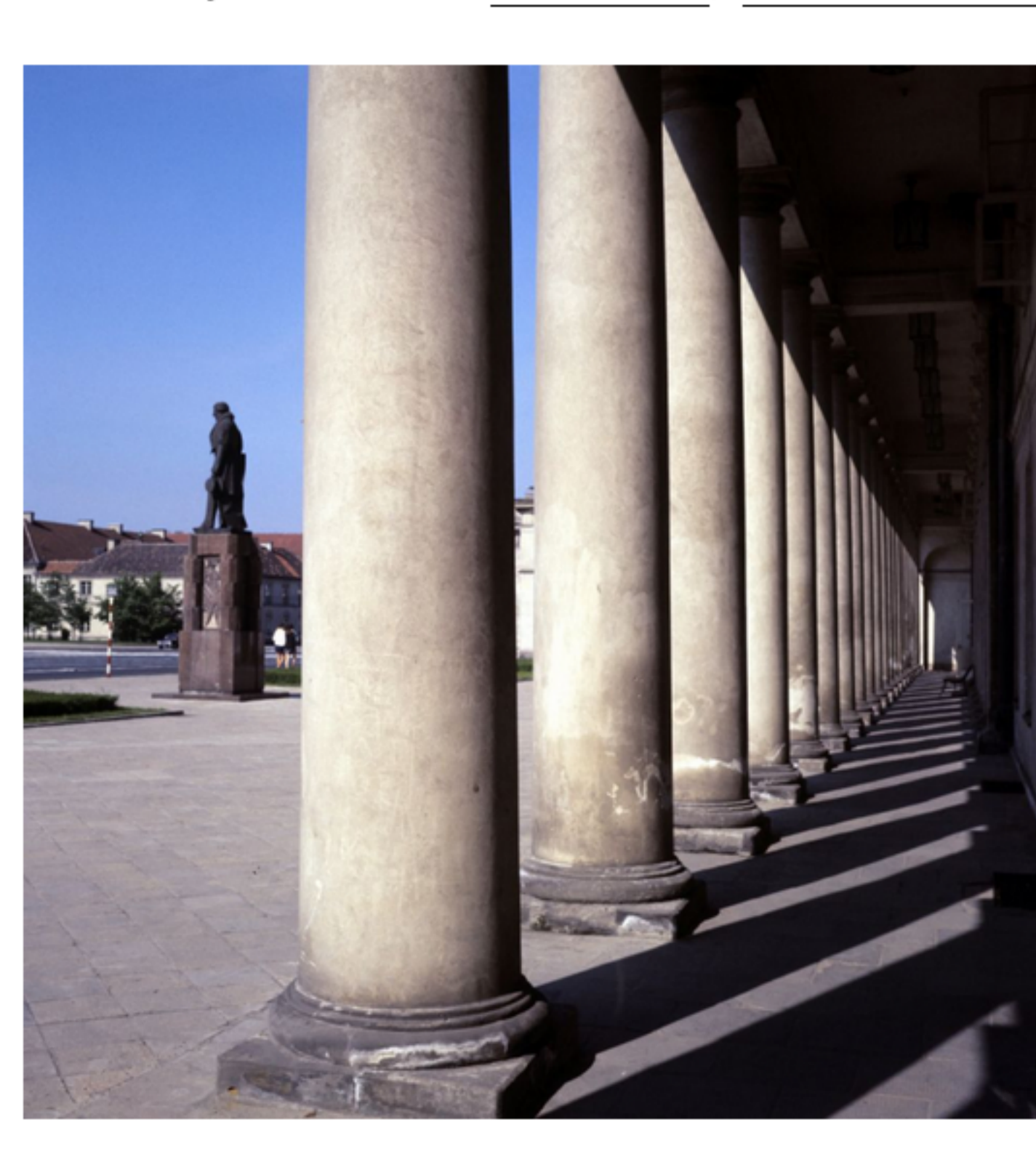
Kolumnada Teatru Narodowego przy placu Teatralnym w Warszawie, przed teatrem pomnik Wojciecha Bogusławskiego dłuta Jana Szczepkowskiego.

PUBLIKACJA: 17.02.2024 Wiadomości , Dziedzictwo kulturowe