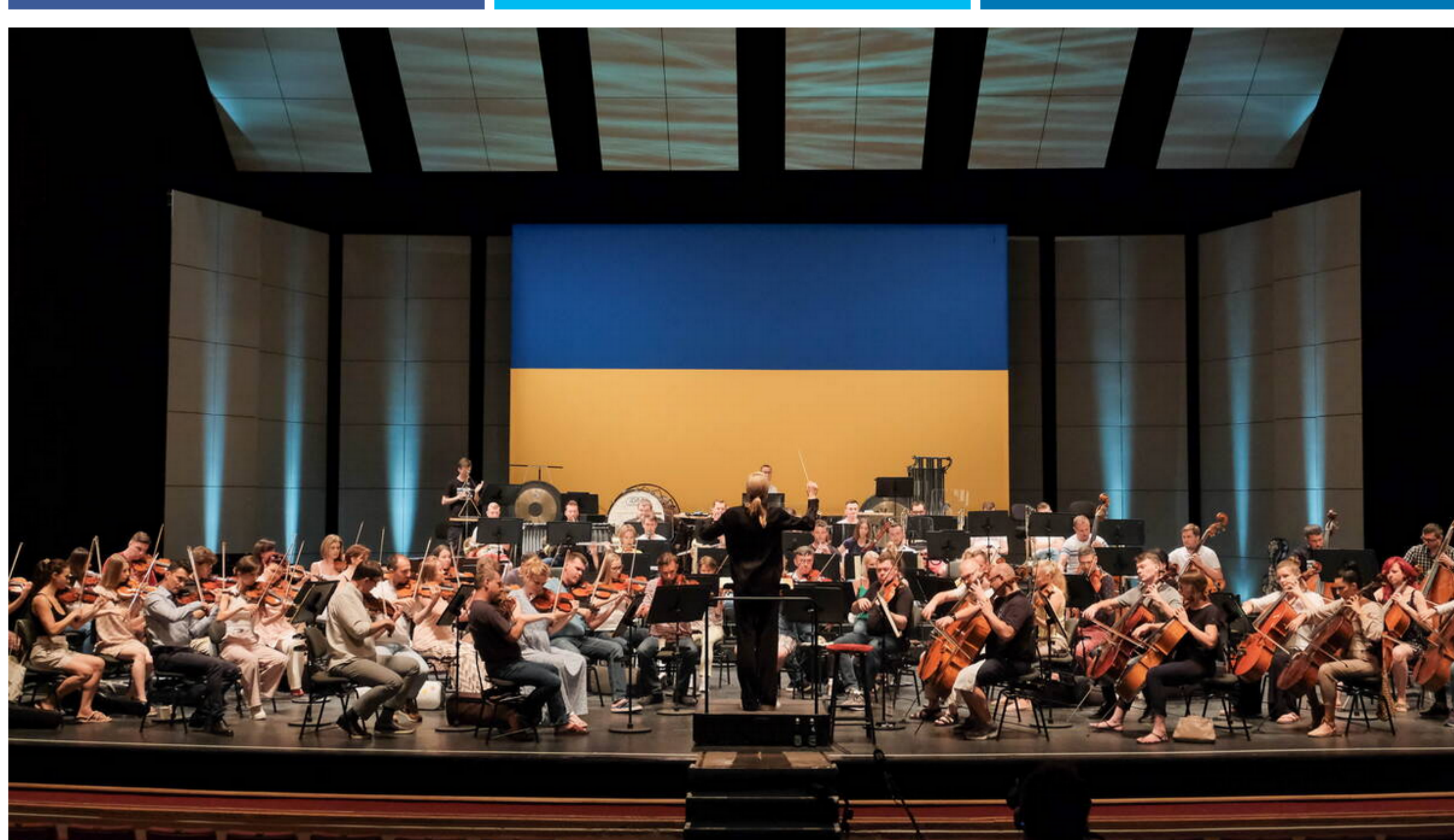
Ukrainian Freedom Orchestra