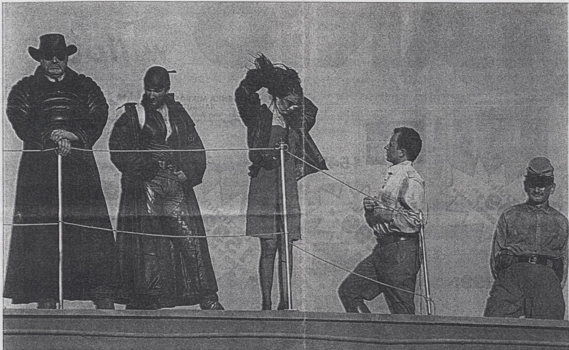
Zamiast teatralnego horyzontu mamy niebo

04-028 Warszawa, Aleja Stanów Zjednoczonych 53 tel. 813 42 34 tel./fax 813 44 95