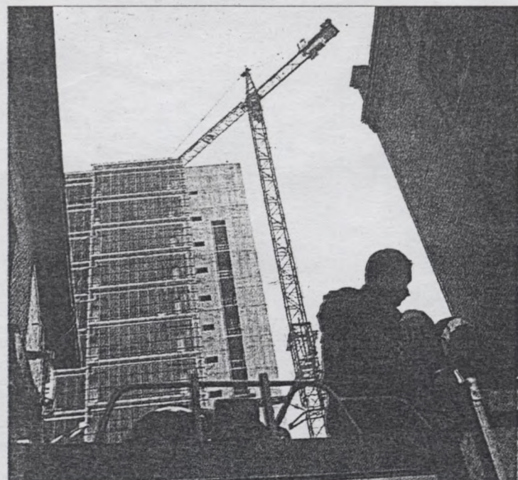
Nad spektaklem czuwają także strażacy