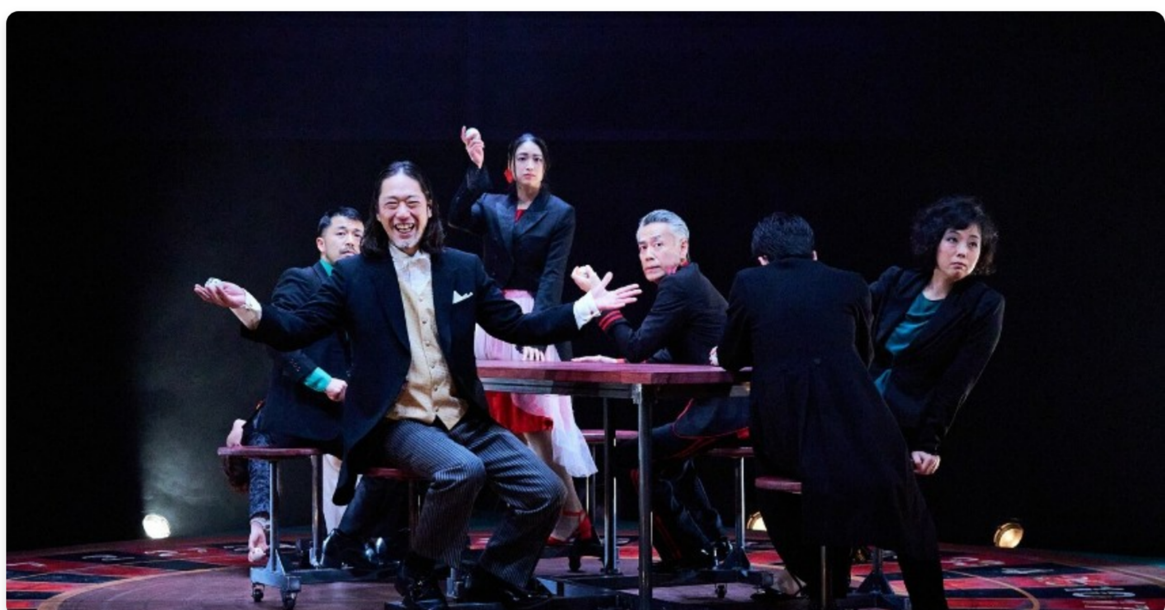
Aktorzy z Kioto grali rewelacyjnie!