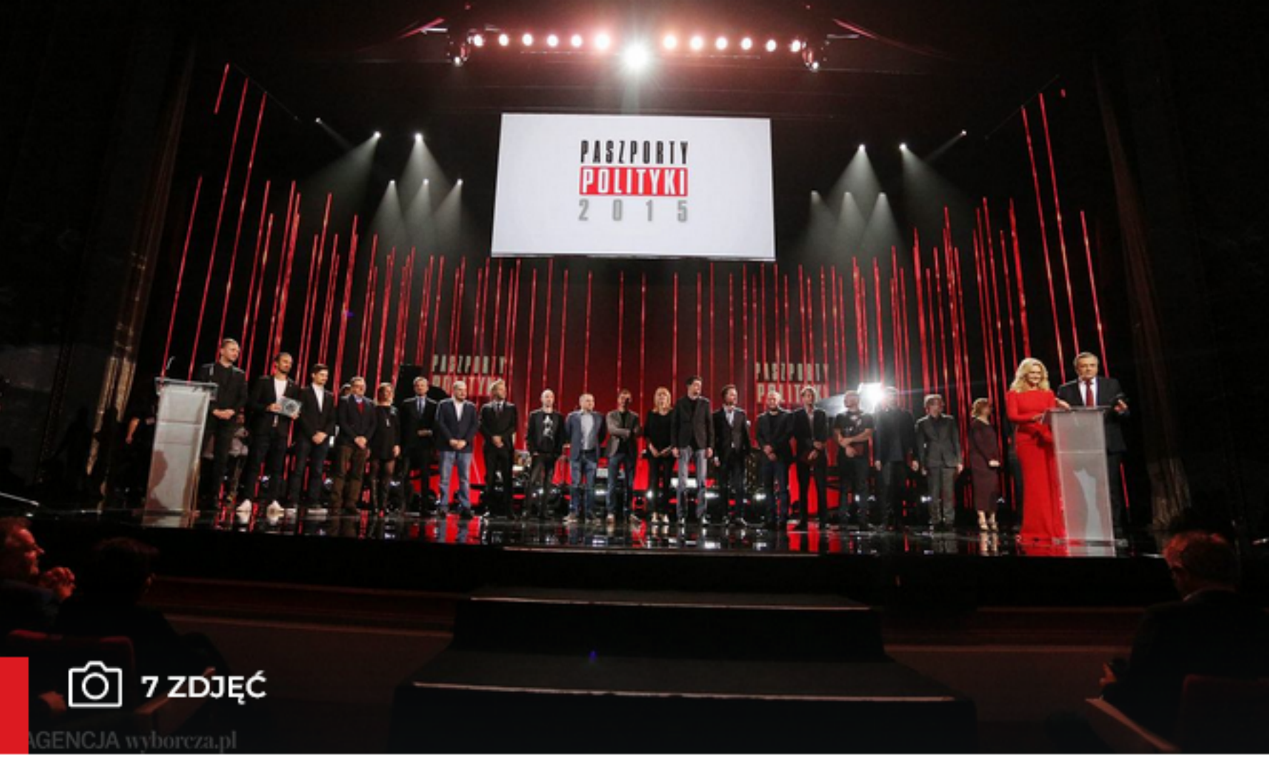
• Zwycięzcy i nominowani na scenie podczas gali Paszporty Polityki 2015.