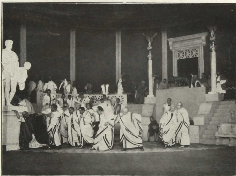
JULJUSZ CEZAR, obraz 5-ty. Śmierć Cezara