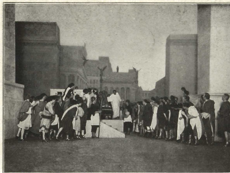
JULJUSZ CEZAR, obraz 6-ty. Mowa Antonjusza