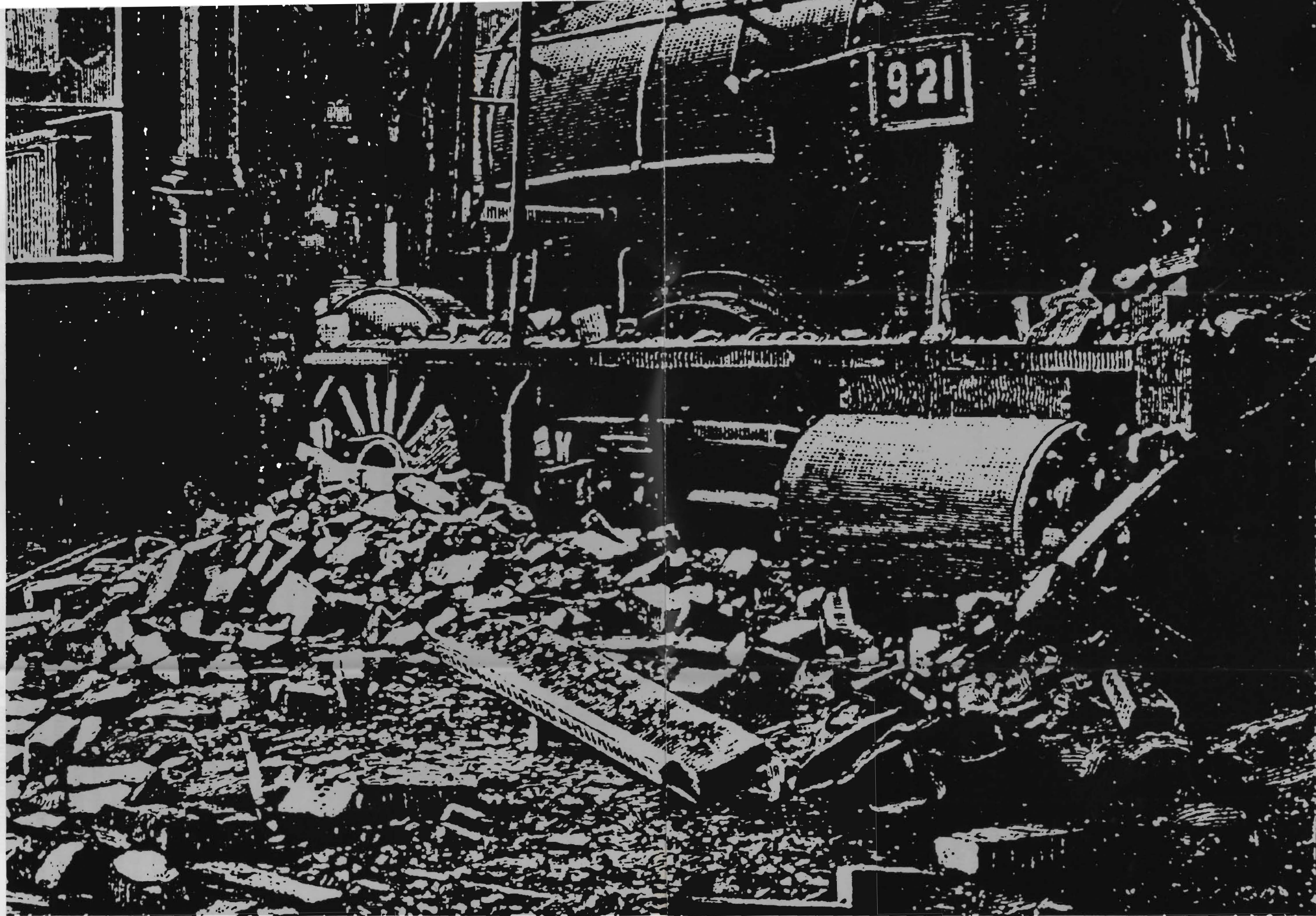
Teatr Polski w Bydgoszczy