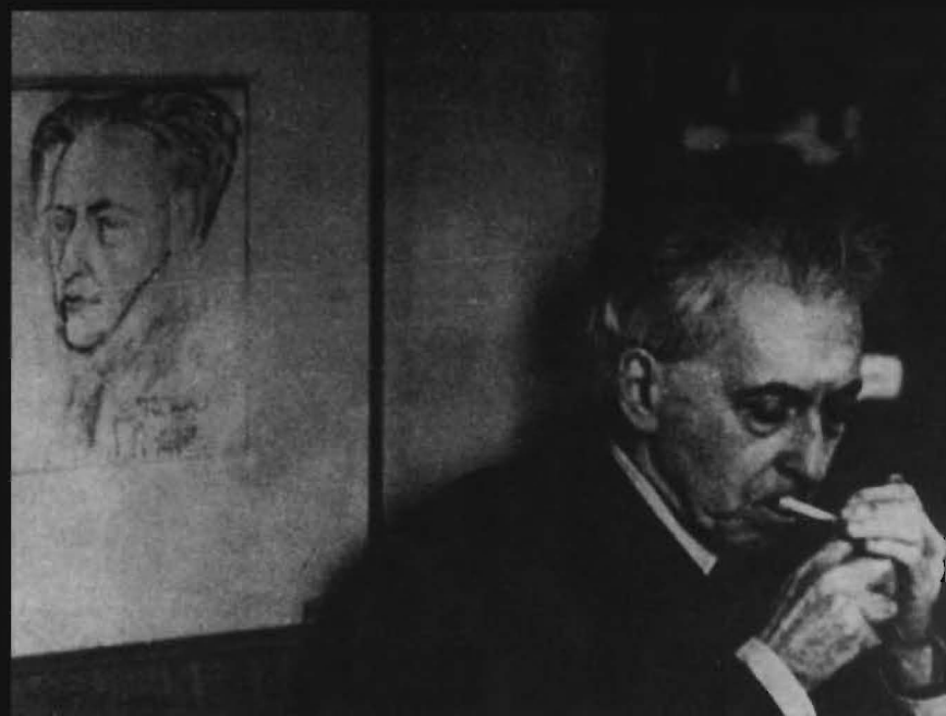
Ilija Erenburg na otwarciu wystawy Picassa w Moskwie w 1956 roku. W głębi portret Erenburga namalowany przez Picassa w 1948 roku.

Ilija Erenburg żył w nieustannym potrzasku, pilnowany przez różne władze, był jednocześnie czarnym baranem, który nieraz beczął pospołu z innymi baranami oraz wyjątkowym białym krukiem, jak nazwała go zaprzyjaźniona z nim przez pięćdziesiąt lat Nadieżda Mandelsztam, rozumiejąca szamotaninę Erenburga oraz jego cierpienie dalekie od wygodnych albi i niekiedy podłych wyborów innych pisarzy radzieckich. Tuż przed śmiercią Erenburg napisał swój ostatni, rozpaczliwy wiersz o baranie, który postanowił umrzeć po swojemu, z dala od stada. Gdy pisarz umarł w Moskwie w 1966 r., władze po cichu wyniosły trumnę i wieńce z drugiej strony budynku, przed którym zgromadziły się tłumy ludzi, pragnących pożegnać Erenburga. Tłum, filmowany przez agentów KGB z dachów krzyczał, że to hańba. Pod murem cmentarza stały kordony służby bezpieczeństwa w mundurach i pełnym uzbrojeniu. Tak został pochowany pisarz bliski wszystkim, którzy sami dobrze znali niebywałą udrękę życia w przerażającym świecie i w okrutnym systemie.