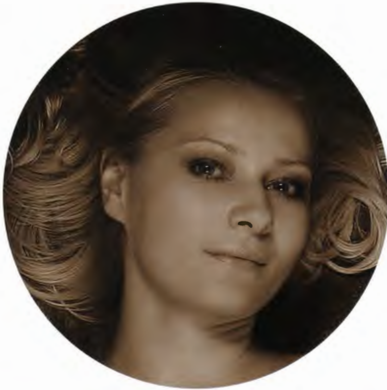
RYBA – Małgorzata Kożuchowska „Musisz być twarda i już! Nie ma się czym przejmować”