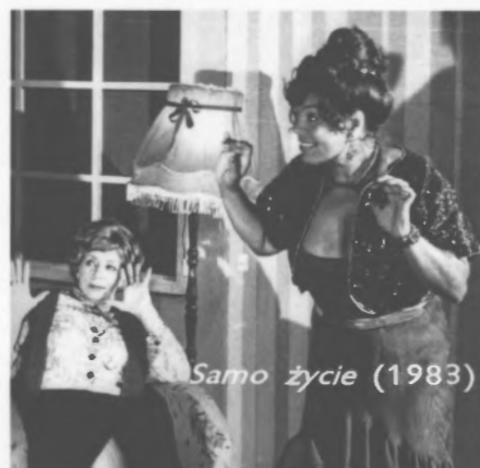
Samo życie (1983)