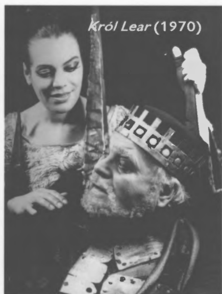
Król Lear (1970)