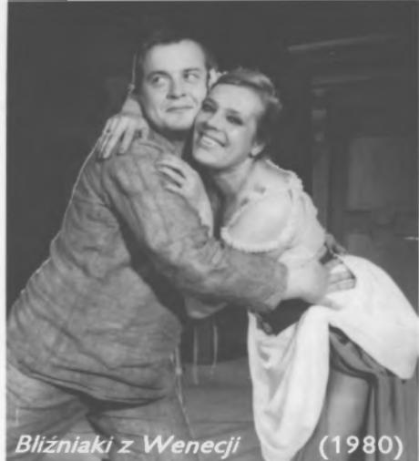
Blizniaki z Wenecji (1980)