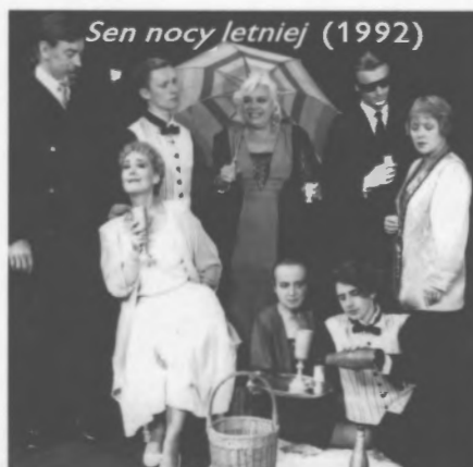
Sen nocy letniej (1992)