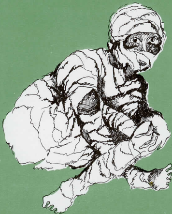
Rys. G. Żubrowska

Napisał ją Szekspir u schyłku życia, żegnając się z teatrem i twórczością. W tej osobliwej, innej od wszystkich komedii zawarł sumę swego ludzkiego i twórczego doświadczenia, genialną wizję świata, wyrażoną spokojnie, z ironią i melancholijnym humorem. Miejscem „Burzy” uczynił samotną wyspę, na której Prospero, wielki mag, uczony i artysta, dokonuje niczym w laboratorium próby ludzkich charakterów. Tej próbie służy wywołana przez Prospera burza. Wielki mag panuje nad materią i czasem, służą mu wszystkie duchy, nie przewidział jednak buntu Kalibana, pierwotnego władcy wyspy.